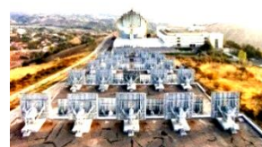
1-rasm. Katta quyosh pechining tasviri.